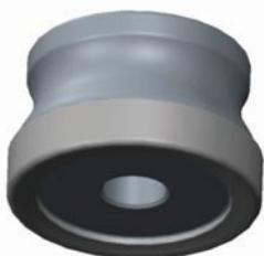
Exemplo de modelo 3D simples (STEP)