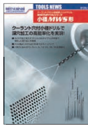
TOOLS NEWS B129J

極小径超硬ソリッドグランドリル MGS グランドリル ■φ0.7 ~ φ3.0mm