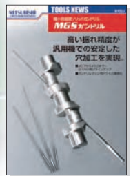
TOOLS NEWS B122J